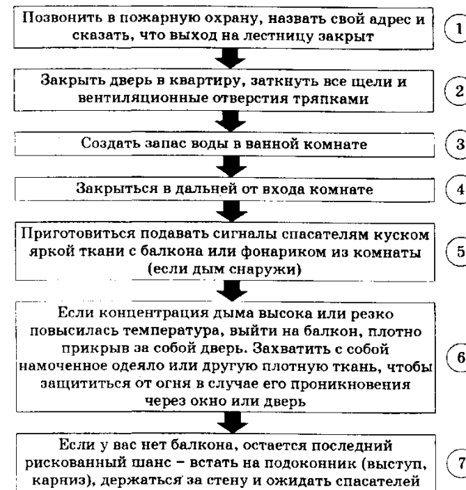
Схема 5. Действия в случае, если нет возможности покинуть квартиру при пожаре в доме