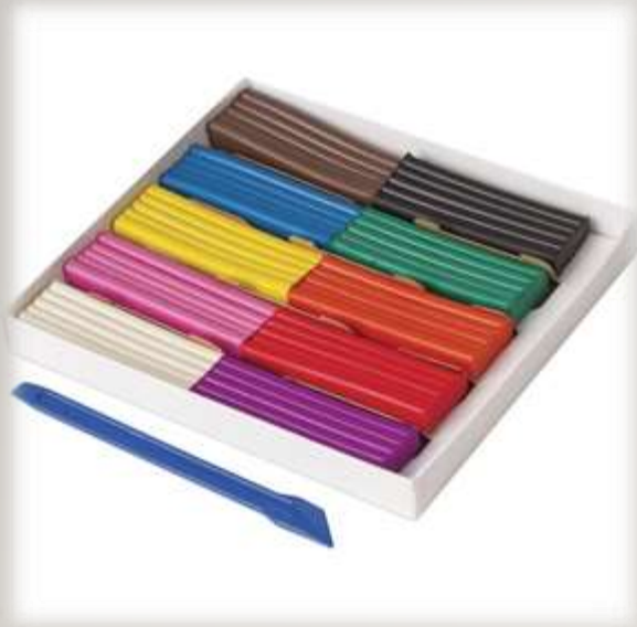
Пластелин и стека