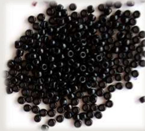
Бисер или бусинки