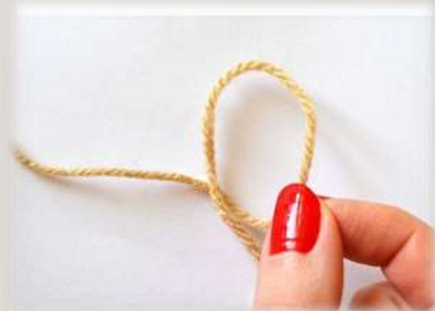
Любая нитка или ленточка