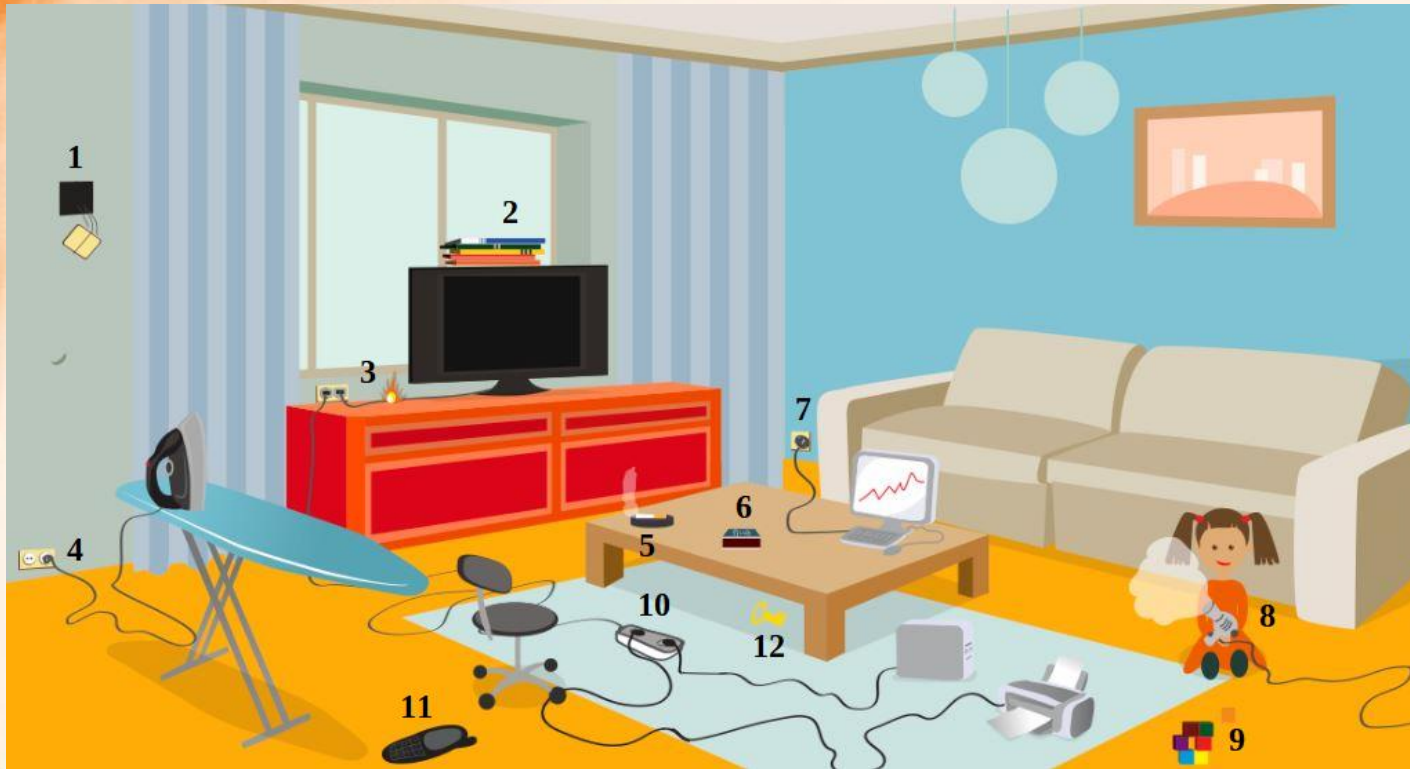
Рис. 3 Проверь найденные нарушения пожарной безопасности в гостиной