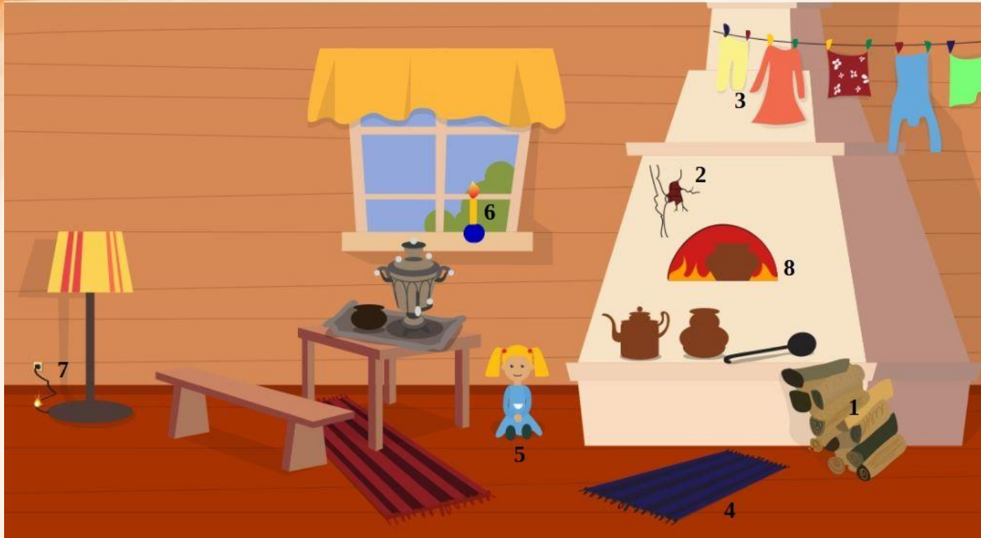
Рис. 1 Проверь найденные нарушения пожарной безопасности в доме