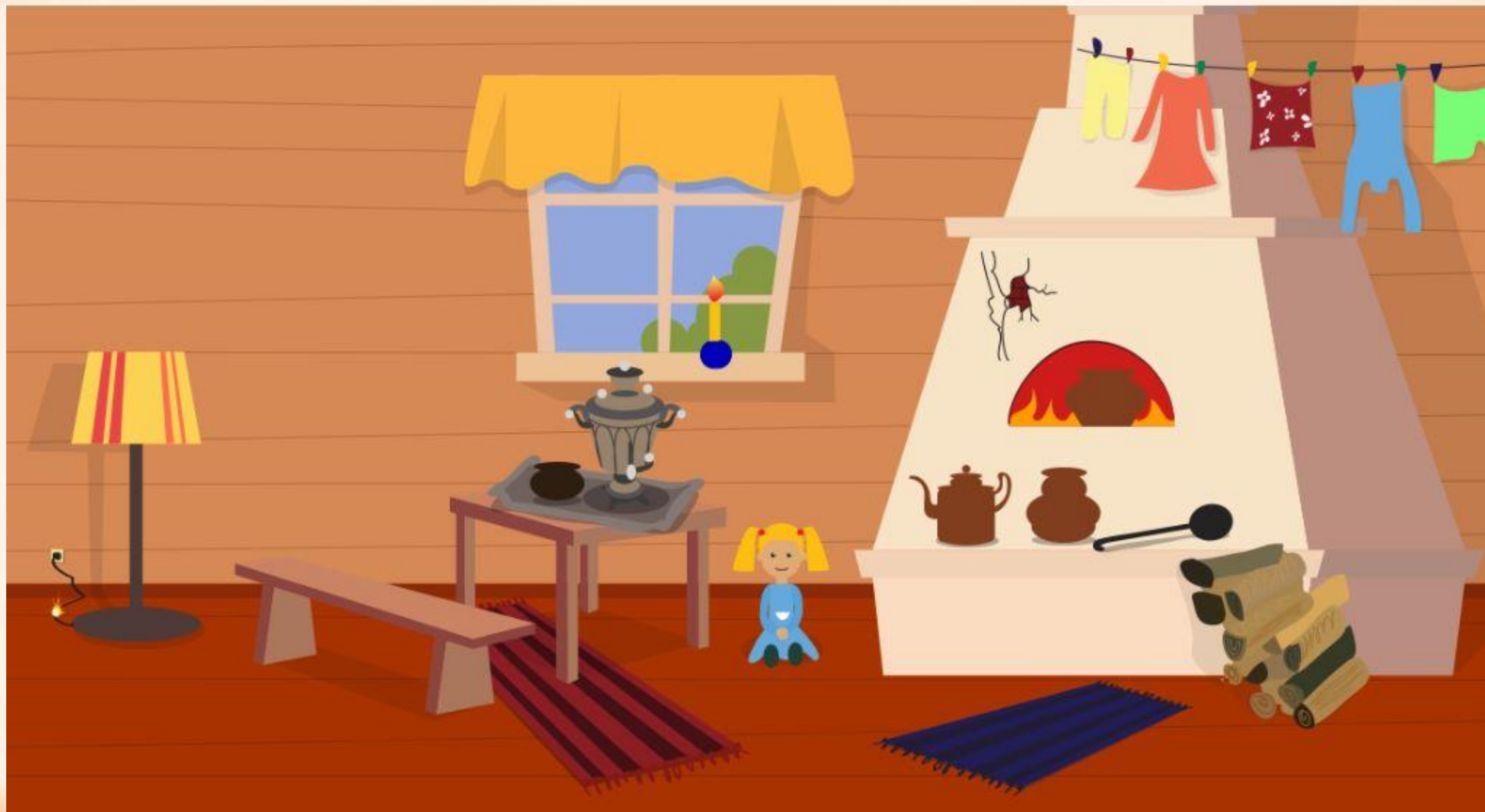
Рис. 1 Найди нарушения пожарной безопасности в доме (8 нарушений)