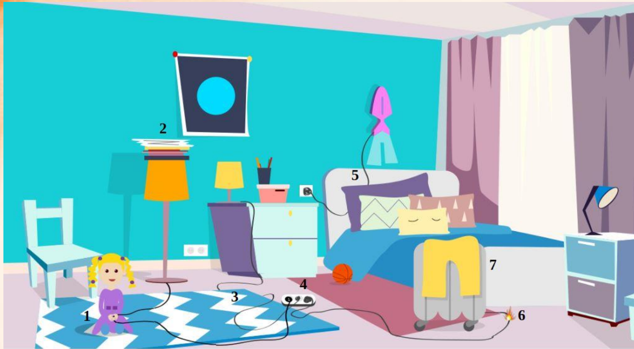
Рис. 5 Проверь найденные нарушения пожарной безопасности в детской