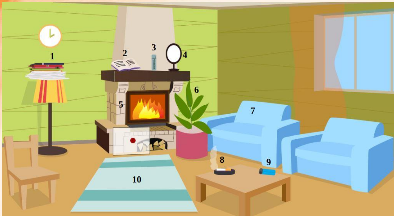
Рис. 4 Проверь найденные нарушения пожарной безопасности в гостиной