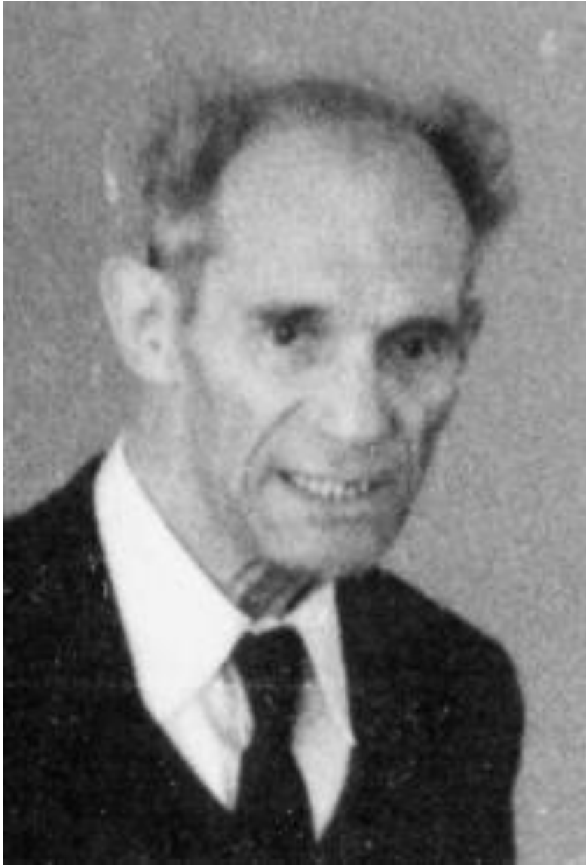
Кикоин Абрам Константинович